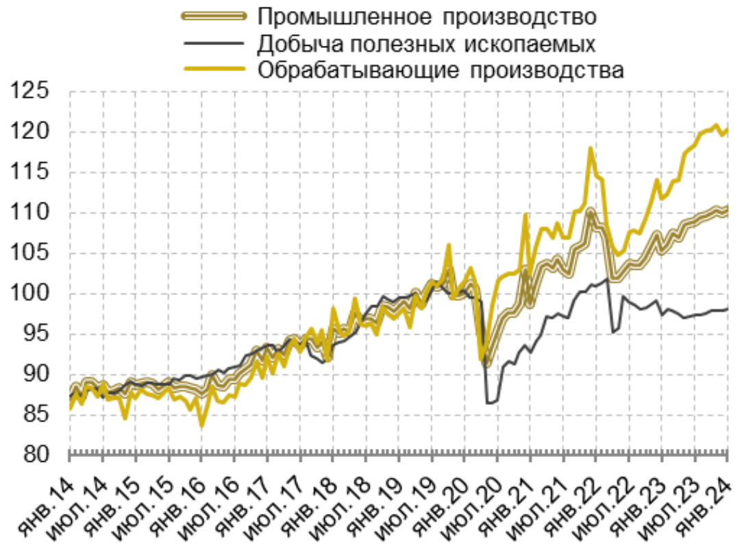
Динамика промышленного производства (100 = 2019 г., сезонность устранена), в %