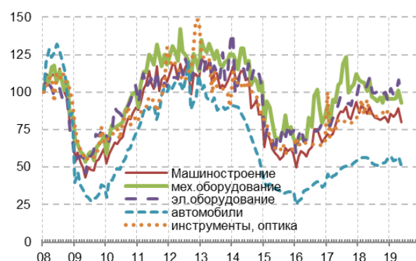
Рис. 4. Индекс стоимости машиностроительного импорта из стран дальнего зарубежья (тренд), 100=январь 2008 г.