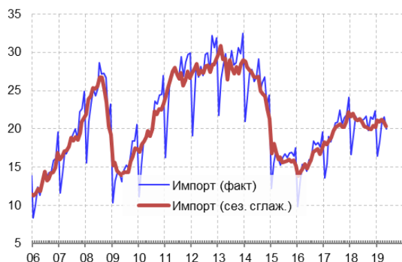
Рис. 1. Динамика стоимости импорта товаров из всех стран, млрд долл.