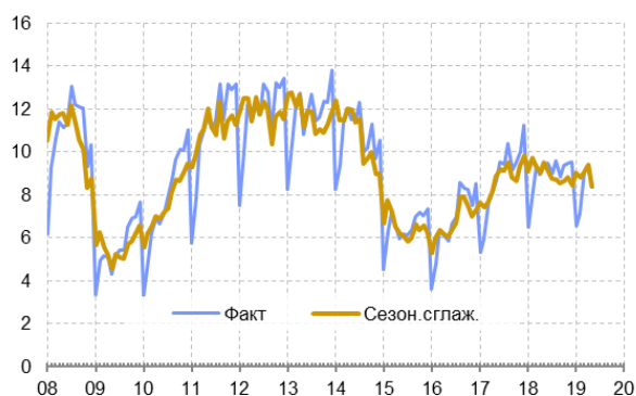
Рис. 3. Динамика стоимости импорта машиностроительной продукции из стран дальнего зарубежья, млрд долл.