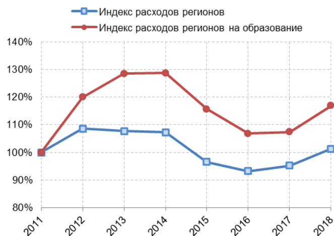
Рис. 2. Динамика общего объема расходов регионов и региональных расходов на образование в постоянных ценах за январь-сентябрь 2011-2018 гг. (2011 г. = 100)

Источник: Минфин РФ, Росстат, расчёты Института «Центр развития» НИУ ВШЭ.