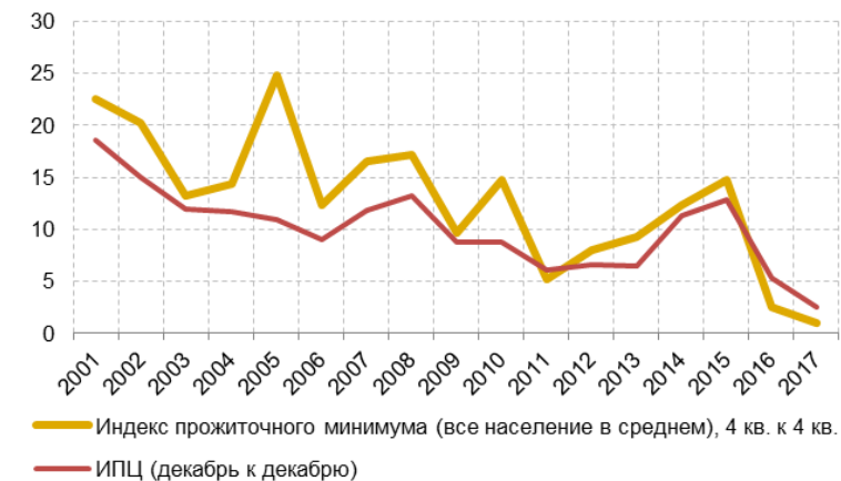
Рис. 1. Индекс потребительских цен для бедных и средний индекс потребительских цен в 2001–2017 гг., в %