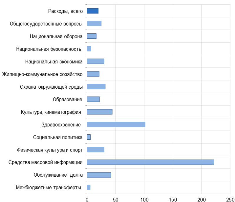
Рис. 3. Темпы роста расходов федерального бюджета в I кв. 2022 г. по отношению к I кв. 2021 г., в %