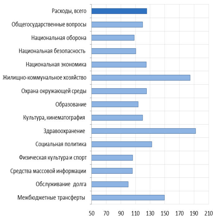
Рис. 2. Темпы роста расходов федерального бюджета в январе-сентябре 2020 г. по отношению к январю-сентябрю 2019 г., в %