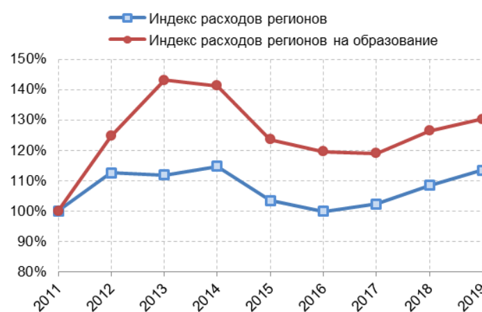
Рис. 2. Динамика общего объема расходов регионов и региональных расходов на образование в постоянных ценах за первый квартал 2011–2019 гг. (2011 г.=100)