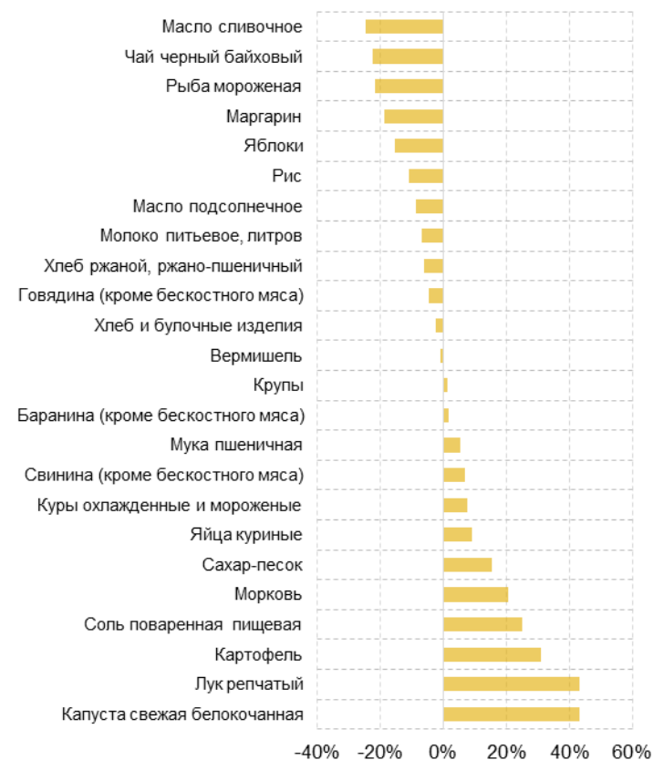
Рис. 5.2. Изменение покупательной способности среднедушевых денежных доходов населения по основным продуктам питания в январе-апреле 2018 г., в % г/г