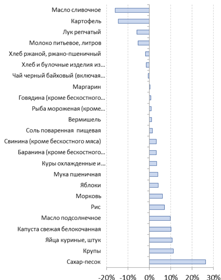
Рис. 6.3. Изменение покупательной способности денежных доходов населения в 2017 г. по отношению к 2016 г.