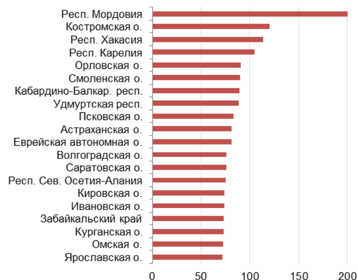
Рис. 7.4. Долговая нагрузка по наиболее проблемным регионам (в %)