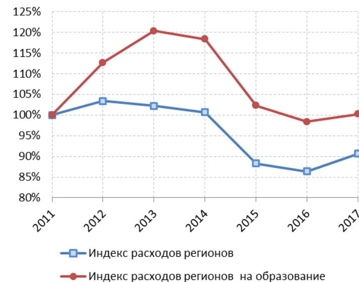
Рис. 7.2. Динамика общего объема расходов регионов и региональных расходов на образование в постоянных ценах за 2011-2017 гг. (2011 = 100)

Источник: Минфин РФ, Росстат, расчёты Института «Центр развития» НИУ ВШЭ.