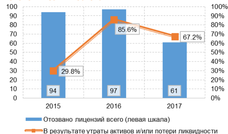
Рис. 8.2. Количество отозванных лицензий и доля «экономических» оснований

Косвенным образом подтверждает этот невесёлый вывод и сам Банк России через беспощадные формулировки всё тех же пресс-релизов. Не секрет, что далеко не все банки потеряли часть, иногда весьма значительную, своих активов благодаря неудачной рыночной конъюнктуре. К сожалению, важным механизмом возникновения таких потерь является просто-напросто вывод активов со стороны лиц, контролирующих эти банк. Если обратиться к статистике, отражающей динамику доли кредитных организаций, лишившихся лицензий благодаря