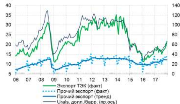
Рис. 4.1. Экспорт товаров, млрд долл.