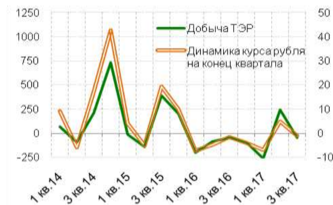
Рис. 3.1. Сальдо прочих доходов и расходов (млрд руб.); прирост (снижение) курса рубля (руб. /долл. США) к предыдущему кварталу (в %) – правая шкала.