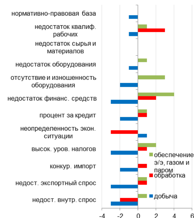
Рис. 2.5. Динамики интенсивности основных факторов, ограничивающих экономический рост в основных секторах промышленности в ноябре 2017 г. относительно ноября 2016 г., разница долей опрошенных респондентов, указавших на фактор (с коррекцией на изменение панели с января 2017 г.), в %