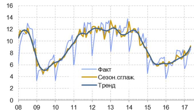
Рис. 5.2. Динамика стоимости импорта продукции машиностроения, млрд долл.

Источник: CEIC Data, расчёты Института «Центр развития» НИУ ВШЭ.