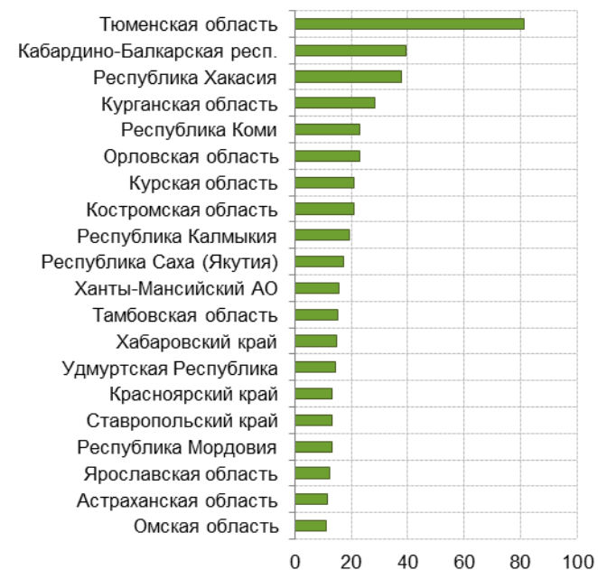
Рис. 7.2. Регионы с наибольшими темпами прироста долга в 2016 г.