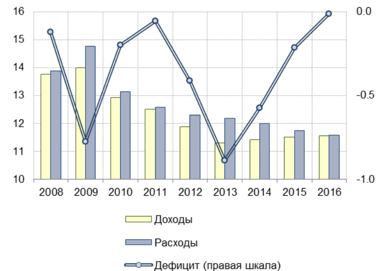
Рис. 4.1. Доходы, расходы и дефицит (правая ось) консолидированных региональных бюджетов за 2008–2016 гг., в % к ВВП