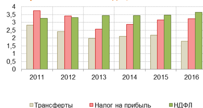
Рис 6.2. Основные виды доходов региональных бюджетов в январе-июле 2011-2016 годов, % к ВВП

Источник: Минфин России, расчёты Института «Центр развития» НИУ ВШЭ.