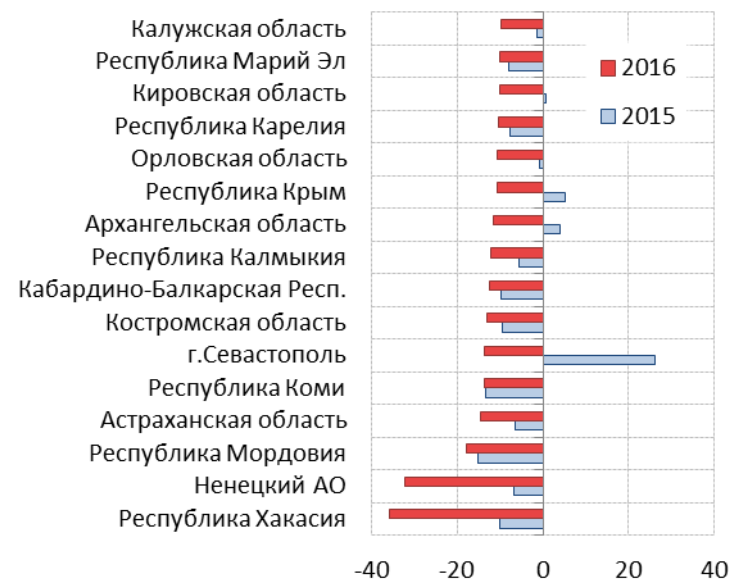
Рис. 6.4. Регионы с наибольшим соотношением бюджетного дефицита и доходов в январе-июле 2015 и 2016 годов, %