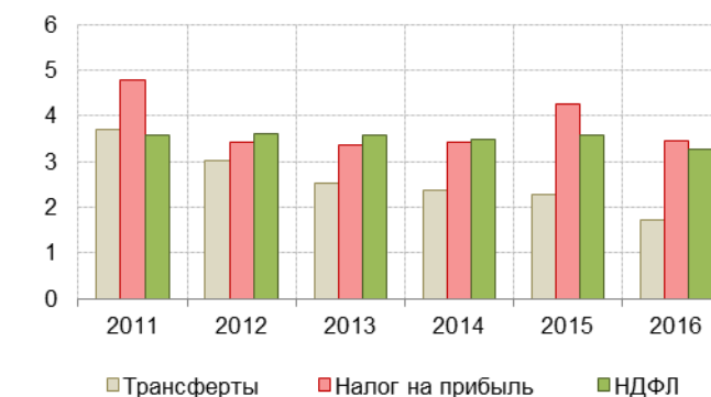
Рис 5.2. Основные виды доходов региональных бюджетов в январе-апреле 2011-2016 годов, % к ВВП

Источник: Минфин России, расчёты Института «Центр развития» НИУ ВШЭ.