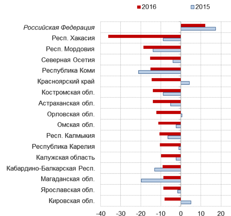
Рис. 5.5. Регионы с наибольшим соотношением бюджетного дефицита и доходов в январе-апреле 2015 и 2016 годов, в %

Источник: Минфин России, расчёты Института «Центр развития» НИУ ВШЭ.