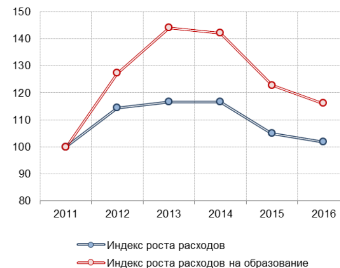
Рис. 5.4. Индексы роста расходов в целом и расходов на образование региональных бюджетов за январь-апрель 2011-2016 годов (2011 год =100%)

Источник: Минфин России, расчёты Института «Центр развития» НИУ ВШЭ.