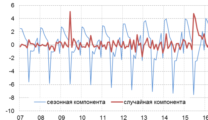
Рис. 3.2. Сезонная и случайная компоненты совокупного дефицита неторговых операций, млрд долл.

Примечание. Данные за апрель 2016 г. – оценка Института «Центр развития» НИУ ВШЭ.