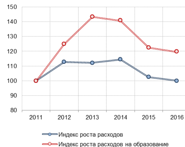
Рис. 8.3. Индексы роста расходов в целом и расходов на образование региональных бюджетов (2011 год =100%)