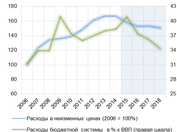
Рис. 4.3. Расходы расширенного бюджета в неизменных ценах и в % к ВВП в 2006–2018 гг.