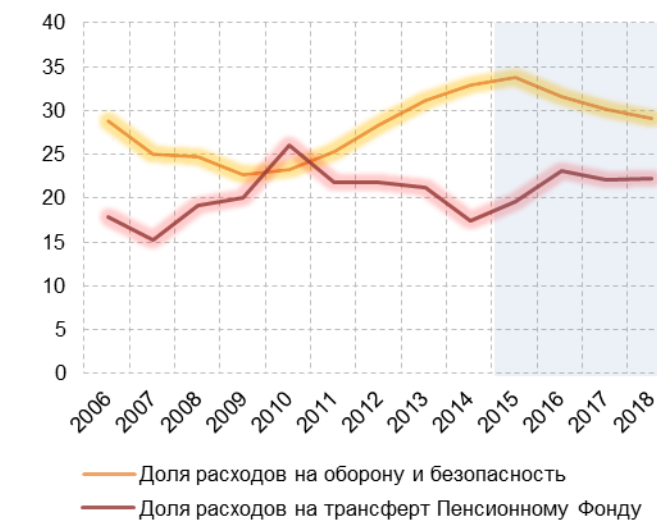
Рис. 4.2. Доли расходов на оборону и безопасность и на трансферт Пенсионному фонду в общем объеме расходов федерального бюджета