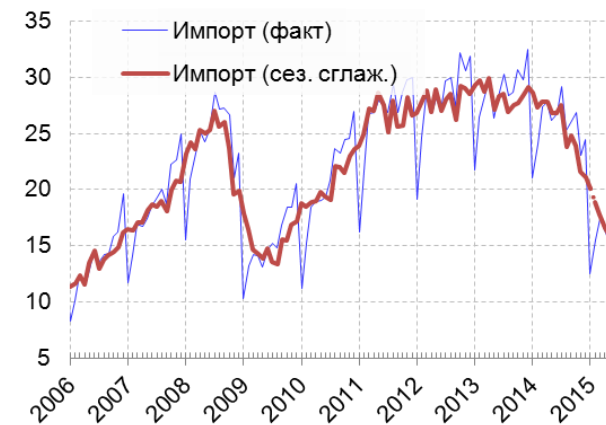
Рис. 2.4. Стоимость всего импорта, млрд долл.