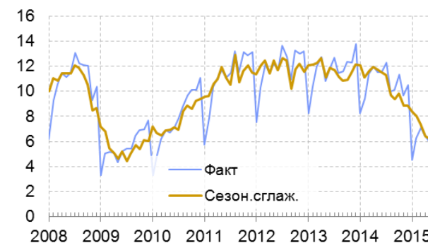
Рис. 2.3. Стоимость машиностроительного импорта из стран дальнего зарубежья, млрд долл.