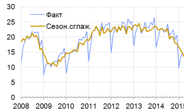
Рис. 2.1. Стоимость импорта из стран дальнего зарубежья, млн долл.

Источник: CEIC Data, ФТС России, расчёты Института «Центр развития» НИУ ВШЭ.