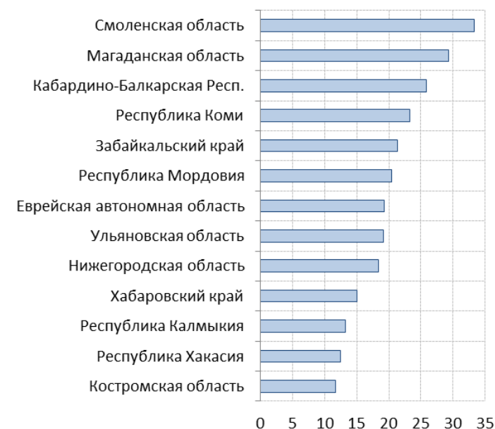
Рис. 6.2. Соотношение бюджетного дефицита и доходов региональных бюджетов за вычетом трансфертов из федерального бюджета за январь-апрель 2015 года, %