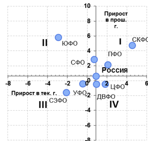
Рис. 6.1. Изменение динамики ИП в январе-декабре 2014 г. по сравнению с январём-декабрём 2013 г. в разрезе федеральных округов