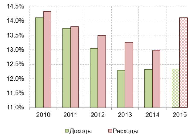
Рис. 3.1. Доходы и расходы консолидированных региональных бюджетов, в % к ВВП

Из 83 регионов (без учета регионов КФО) с дефицитом бюджет исполнили 74 региона. К «лидерам» по соотношению бюджетного дефицита и региональных доходов относятся Амурская область (21,7%), Удмуртия (20,7%), ЕАО (17,5%), Мурманская область (17%, рис. 3.2).