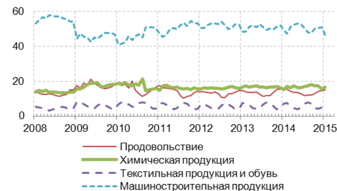
Рис. 4.3. Структура импорта из стран дальнего зарубежья, %