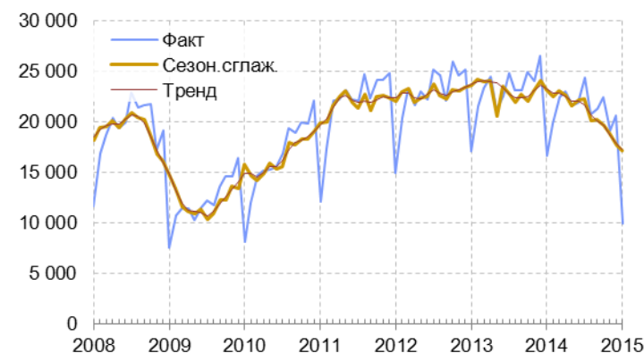
Рис. 4.1. Стоимость импорта из стран дальнего зарубежья, млн. долл.