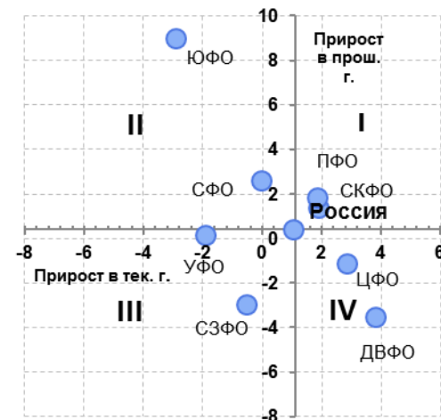
Рис. 8.1. Изменение динамики ИП в январе-июне 2014 г. по сравнению с январём-июнем 2013 г. в разрезе федеральных округов