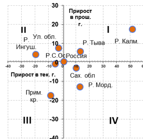
Рис. 8.2. Изменение динамики ИП в январе-июне 2014 г. по сравнению с январём-июнем 2013 г. в разрезе некоторых субъектов Российской Федерации