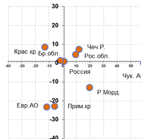
Рис.7.3. Изменение динамики ИП в январе-апреле 2014 г. по сравнению с январём-апрелем 2013 г. в разрезе некоторых регионов