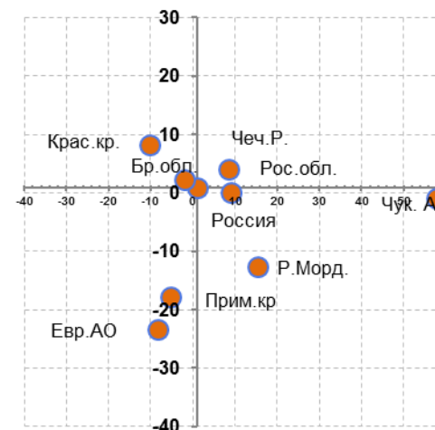
Рис.7.4. Изменение динамики ИП в январе-мае 2014 г. по сравнению с январём-маем 2013 г. в разрезе некоторых регионов