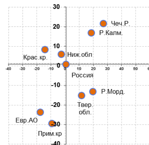
Рис. 9.2. Динамика Интегрального показателя в I квартале 2014 г. (ось X) по сравнению с I кварталом 2013 г. (ось Y) в некоторых субъектах РФ