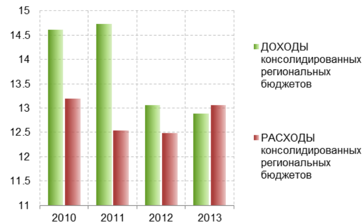
Рис. 7.1. Доходы и расходы консолидированных региональных бюджетов, в % ВВП

По итогам 9 месяцев 2013 г. финансовое положение, по сравнению с предыдущими тремя годами, ухудшилось и в среднем по России, и во всех