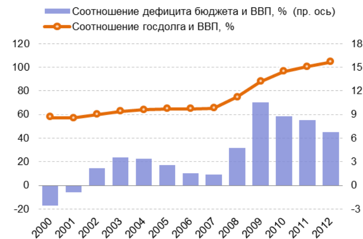
Рис. 1.1. Динамика соотношения бюджетного дефицита и госдолга и ВВП США

Секвестр расходов, в соответствии с BCA, примерно поровну распадается между оборонными и необоронными расходами. Важно отметить, что речь идет о сокращении расходов в годовом выражении: фискальный год в США начинается с 1 октября – это означает, что к концу марта закончится его первая половина, в течение апреля-сентября 2013 г. Расходы сократятся на 44 млрд. долл.