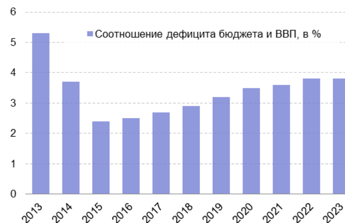
Рис. 1.2. Прогноз бюджетного дефицита США в условиях секвестра бюджета