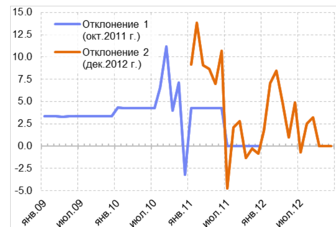
Рис. 5.1. Результаты пересчёта Росстатом месячных объёмов строительных работ в действующих ценах (отклонение от предварительных данных), в %