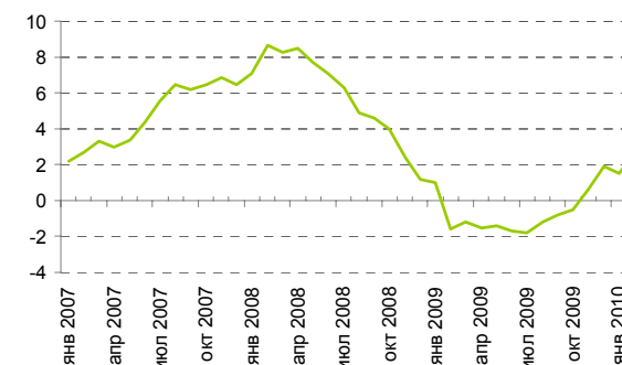
Потребительская инфляция, % г/г