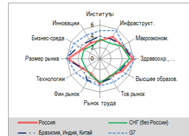
Оценки положения России и других стран по составляющим рейтинга глобальной конкурентоспособности в 2010гг. (по 7-балльной шкале)