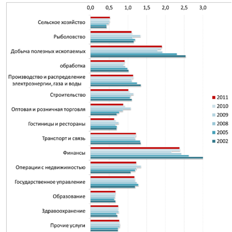
Рис. 5.1. Отношение зарплат в отдельных секторах к средней зарплате по России, раз