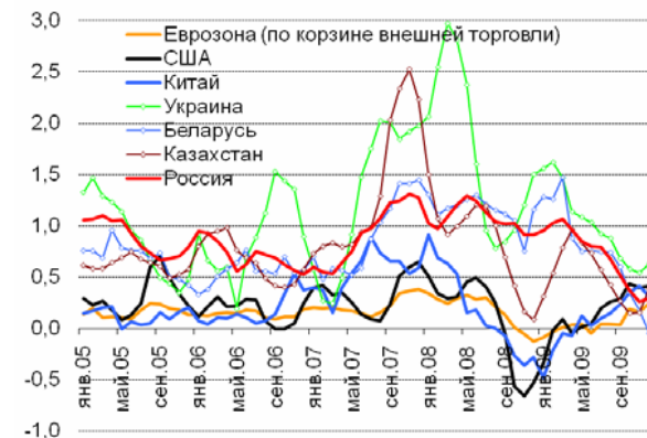
Средние темпы роста потребительских цен в России и в странах-основных торговых партнерах (среднеквартальная скользящая инфляция, сезонность устранена).