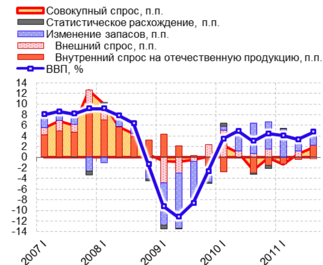
Рис. 3.2. Динамика ВВП и вклад в ВВП составляющих по виду спроса (прирост к соответствующему кварталу предыдущего года)