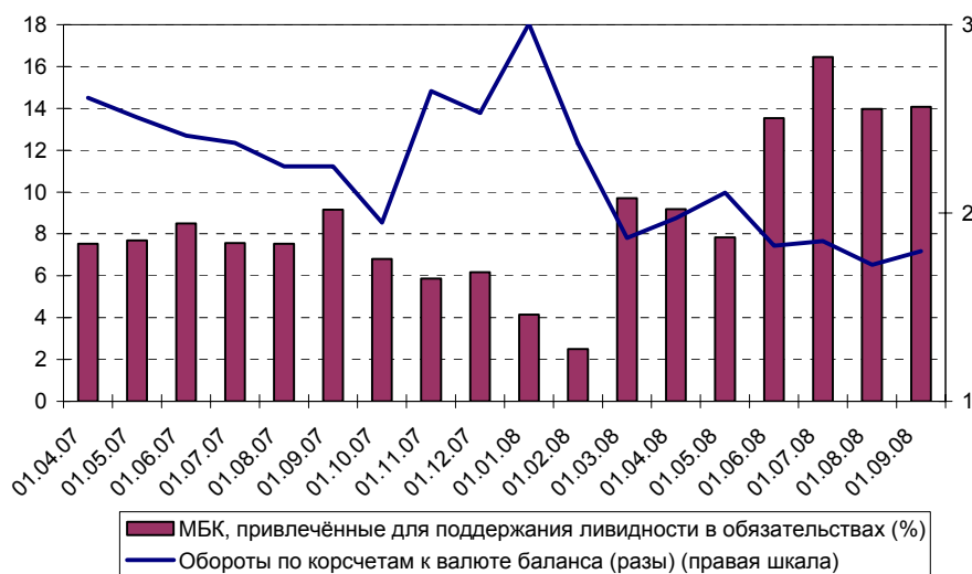
Динамика отдельных показателей деятельности Связь-банка