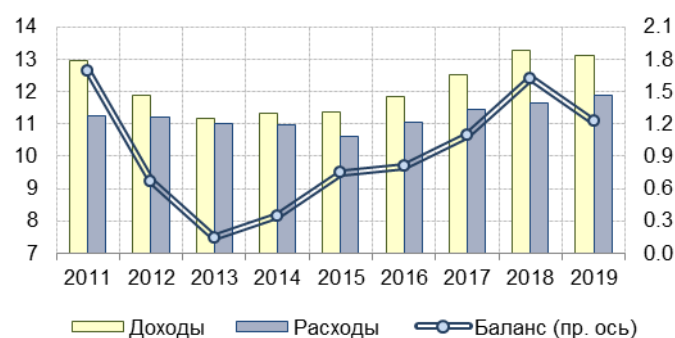
Рис. 1. Доходы, расходы и баланс консолидированных региональных бюджетов за январь-октябрь 2011–2019 гг., в % к ВВП

Источник: Минфин РФ, расчёты Института «Центр развития» НИУ ВШЭ.