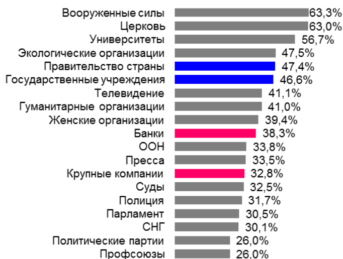
Рис. 3. Доверие населения различным организациям в России

Примечание. Доля опрошенных, доверяющих указанным организациям полностью и в некоторой степени. По России подобный опрос последний раз проводился в 2011 г.